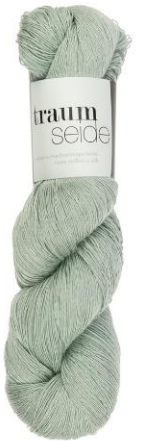
051 reseda hell