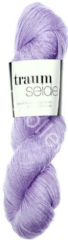
041 amethyst hell