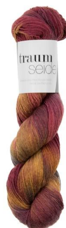
121 Wilder Wein