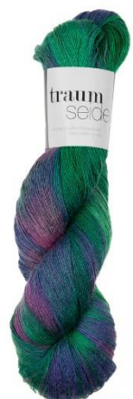
124 Costa Verde