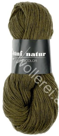
19 oliv hell