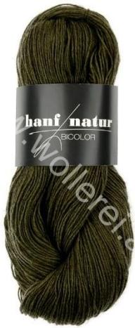
20 oliv dunkel