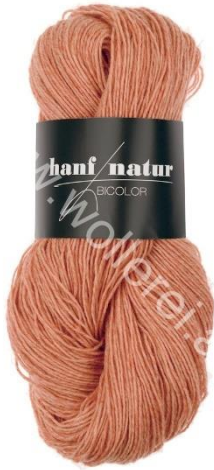
11 guadelupe hell