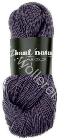
14 blue velvet