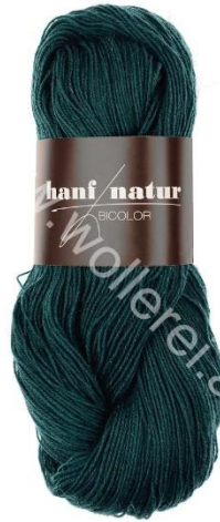
21 flaschengrün dunkel