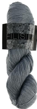
3039 grau silber