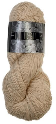
3050 beige hell