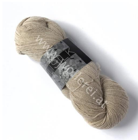
3053 beige dunkel