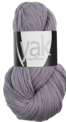
23 amethyst hell