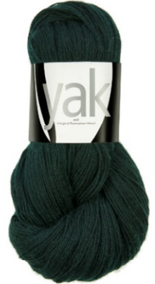
06 oliv dunkel