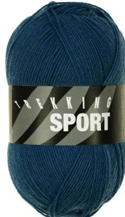
1404 blue velvet