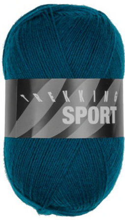
1422 petrol dunkel