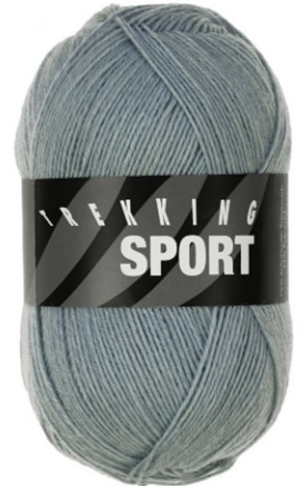
1402 blaugrau hell