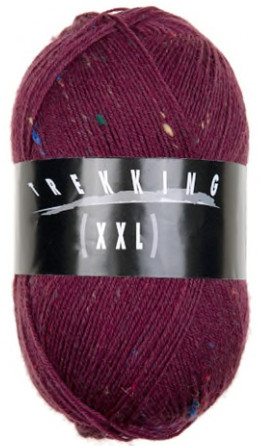
302 beere dunkel