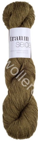
065 olive gold