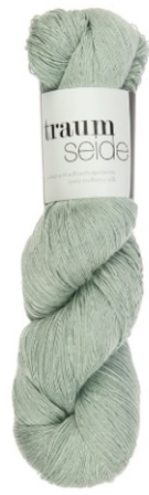
051 reseda hell