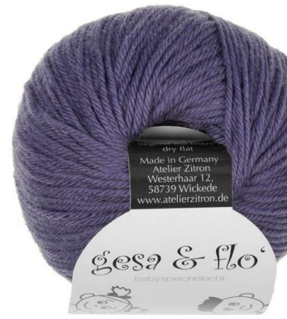
27 amethyst dunkel