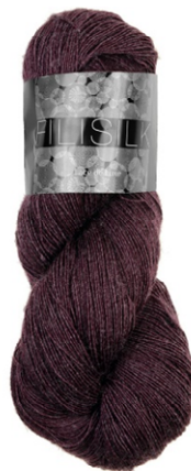
3055 beere dunkel