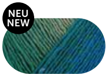
landscape color 00086