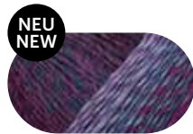
mystic color 00085