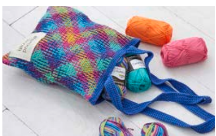
PLANNED POOLING PROJECT BAG S10556A | hello trend Bag it!