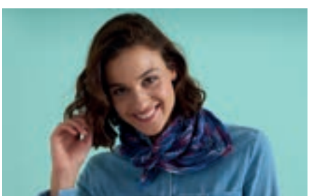
NILA S11316 | Webdesign