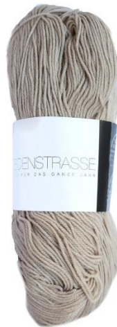
9024 taupe hell