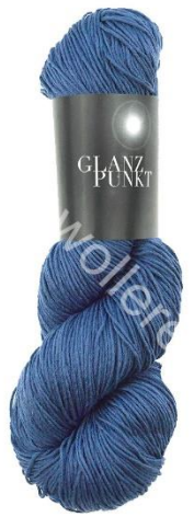
8026 blue velvet