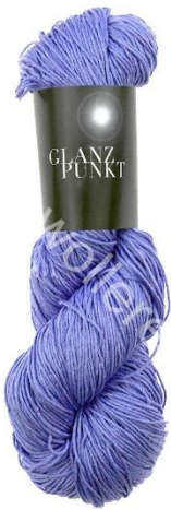
8027 amethyst hell