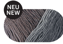
misty fog 00088