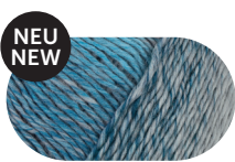
winter mood 00090