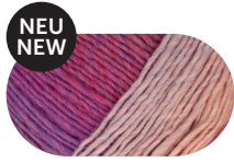
sweet berries 00089