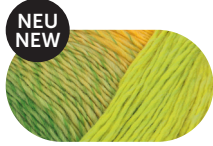
autumn leaves 00092