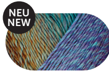
winter sunset 00091